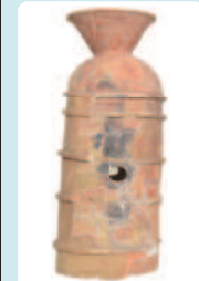
鱧付朝雛形円筒埴輪 (能褒野神社寄託)

展示室に並んださまざまな時代の実物や、復元された古墳、城下町の模型もあります。数十年前まで実際に使われていた道具も展示しています。