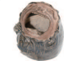
関萬古達磨形手炉 (三谷家)

展示室に並んださまざまな時代の実物や、復元された古墳、城下町の模型もあります。数十年前まで実際に使われていた道具も展示しています。