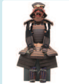
胸取毛引威横短剣 二枚銅具足 (山田家寄託)

第1部では、亀山城主石川家の家臣が武士として、どんな備えをし、日常の心構えをしていたのか。第2部では、石川家の家老加藤家にみる戦国時代から江戸時代までにどんな変化があったのか。この二つの疑問について、戦国時代が終わった後の、江戸時代の武士の武士たる所以をうかがいます。