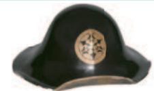
加藤家家紋入陣笠